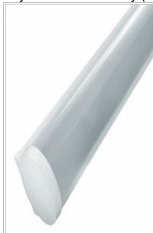
WIDOK W STANIE NIEAKTYWNYM (napis niewidoczny)