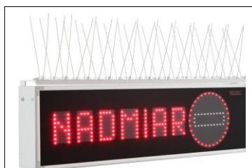
Pozycja montażowa w stanie aktywnym (z opcjonalnym APTK)